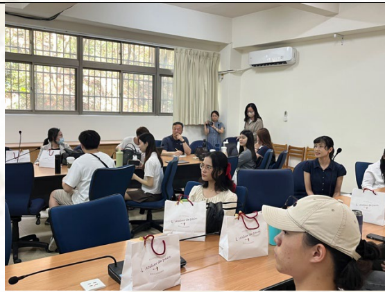
講座吸引外文系老師與外系學生一同共襄盛舉