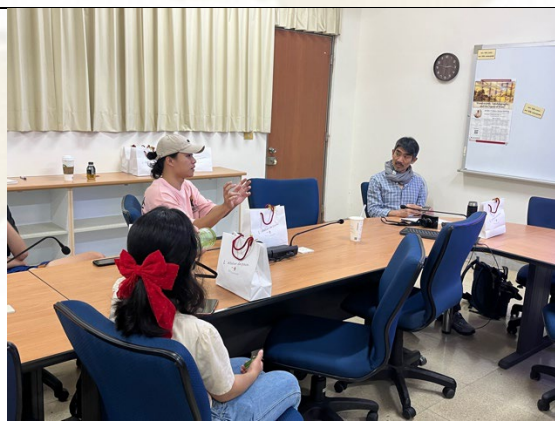
Q&A 環節中不同科系學生提出跨領域研究議題